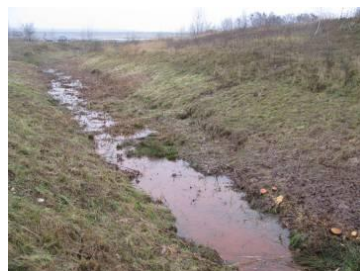
vor Sicherung (Böschungsbruch infolge Grundwasserwideranstieg)