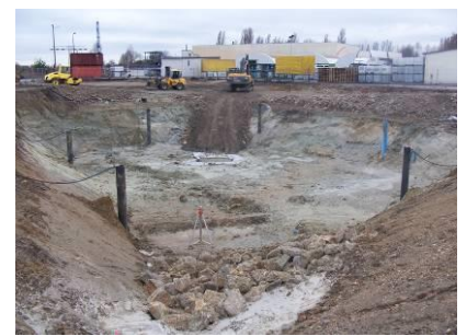
Tiefenaushub Tanklager LMT III