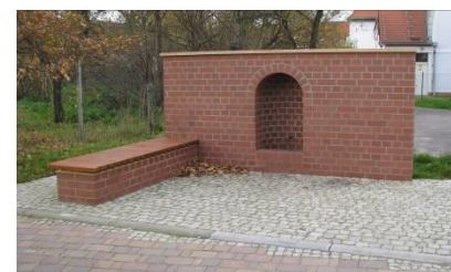
Bauwerk „Artesischer Brunnen“